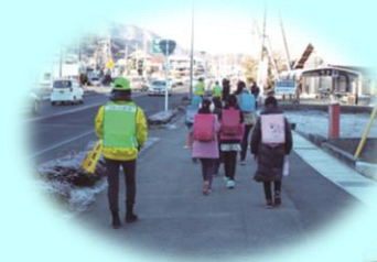
子どもの見守り活動