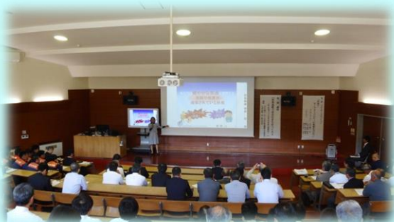
平成 30 年 4 月 29 日 (日) セーフコミュニティ取組宣言 キックオフ記念講演会の様子