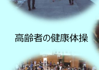
高齢者の健康体操